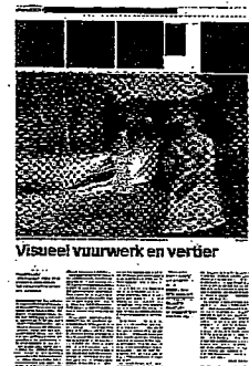
Visueel vuurwerk en vertier