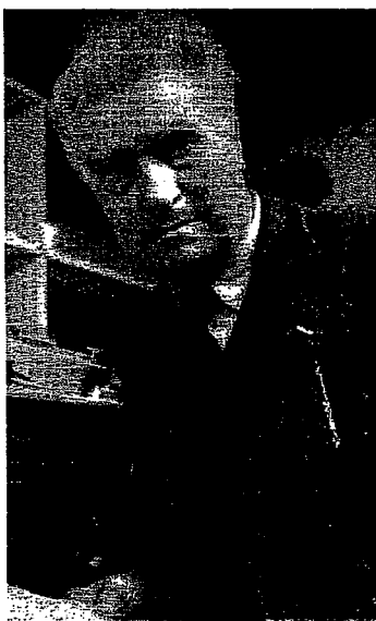
Edgard Varèse. FOTO PHILIPSPERSBUREAU

Muzikaal gezien kreeg het complete oeuvre van de visionair Varèse